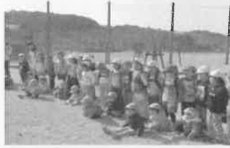
お別れ遠足：さくら公園